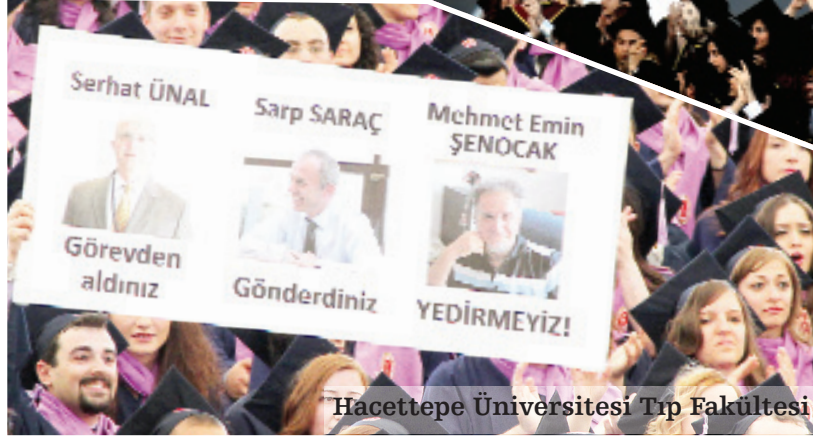
Hacettepe Üniversitesi Tıp Fakültesi