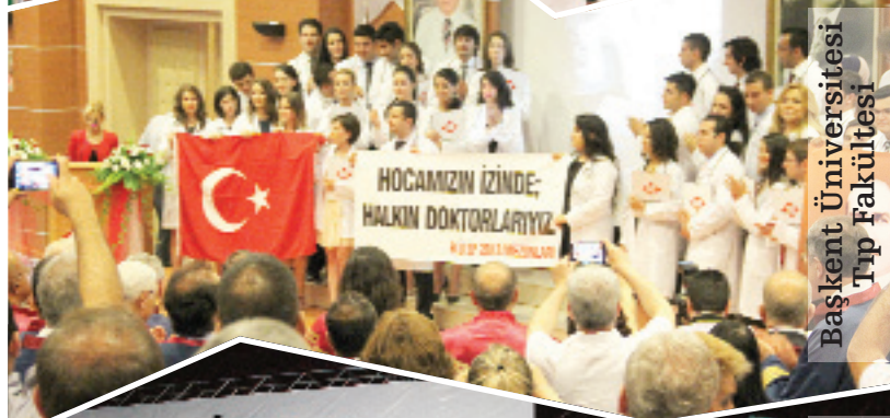
Başkent Üniversitesi Tıp Fakültesi