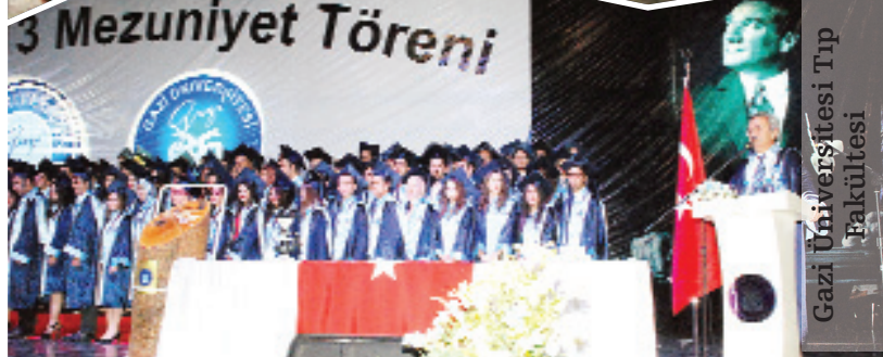
Gazi Üniversitesi Tıp Fakültesi