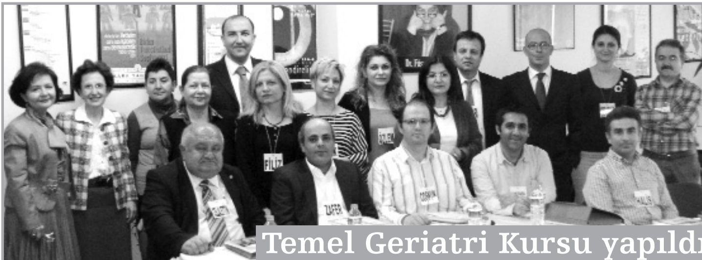
Temel Geriatri Kursu yapıldı

SGK, Danıştay'ın kararı ile yürütmesi durdurulan Sağlık Uygulama Tebliği'nin 6.1.1.Ç. maddesinin "Reçetelere yazılabilecek ilaç miktarı" başlıklı (1) numaralı fıkrasının ilk cümlesini 06.04.2011 tarihi itibarı ile yürürlükten kaldırdı. 06.04.2011 tarihinden itibaren bir reçetede dört kalem ilaçtan fazla ilaç reçeteye yazılabilecek.