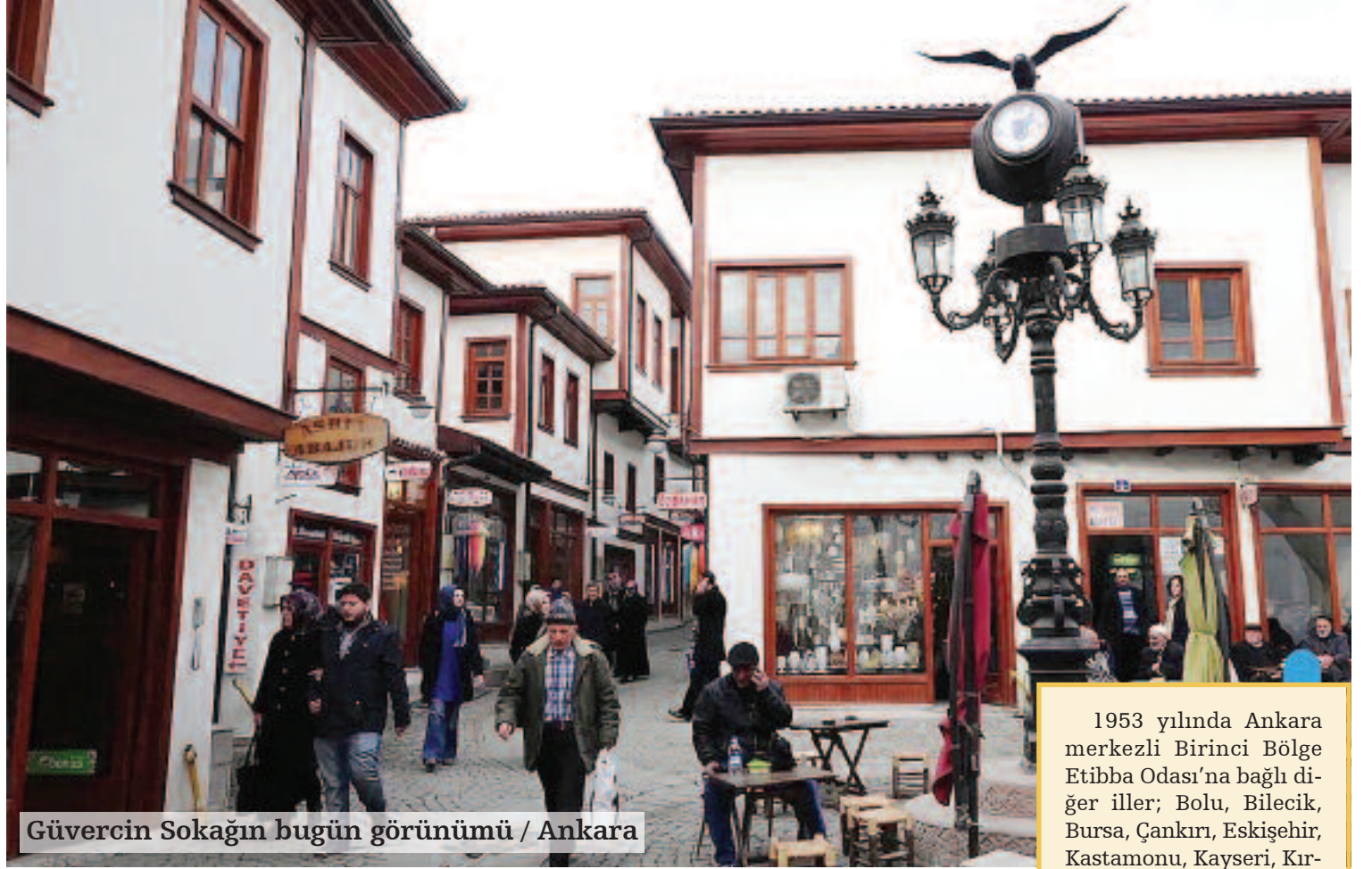
Güvercin Sokağın bugün görünümü / Ankara

Yeni Kanun, halk sağlığına hizmet, meslek geleneklerini muhafaza ve geliştirmek, azalarının maddi manevi hak ve menfaatlerini korumak, onları muayyen refah seviyesine ulaştıracak gerekli iş sahalarını bulmak, İş Kanunu ile Sosyal Kanunların ve bunlara bağlı nizamname ve talimatname hükümlerinin tatbikatında meslek ve meslekdaşların hak ve menfaatlerini korumak, Sosyal Sigorta işlerini tanzim etmek ve her türlü iş tevziinin adilane bir surette düzenlenmesine çalışmak gibi meslek ve meslek-