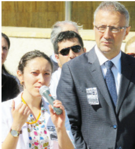
Tıp Fakültesi 6. sınıf öğrencisi