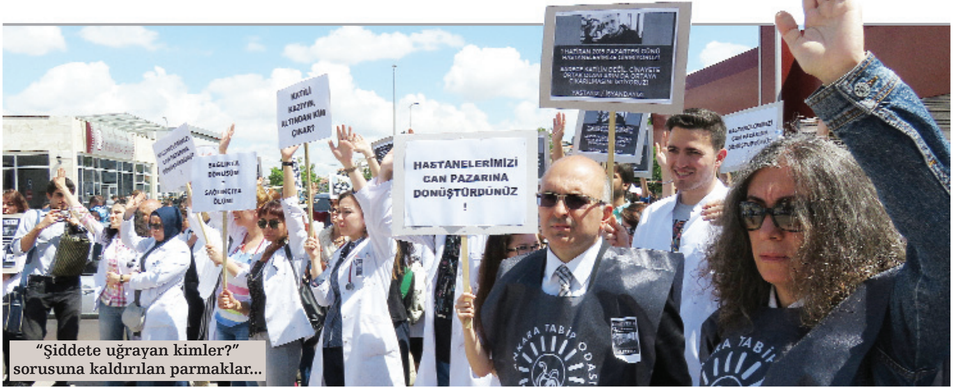
"Şiddete uğrayan kimler?" sorusuna kaldırılan parmaklar...

nun sorumluları, bu katili üretenler kendi sorumluluklarını üstlerinden atmak için çok basit bir eylem tarzıyla bu tepkimizi yok etmeye çalışıyorlar." açıklamasını yaptı.