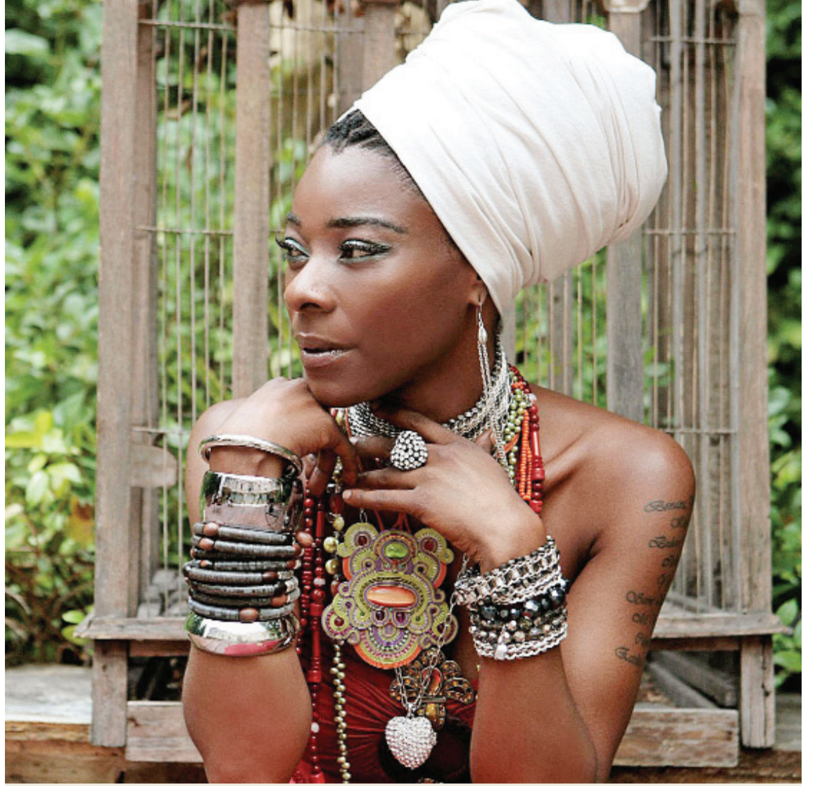
İspanyol şarkıcı Buika, 14 Nisan 2012 Cumartesi izlenebilecek.

Festival programına, Sevda Cenap And Vakfı'nın internet sitesinden ulaşılabilir.