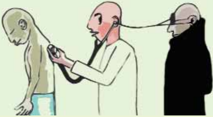
Karikatür: Taner Özek

Bu ifadeler yeni çalışma kapsamında, "il genel sekreterleri, hastaneler bazında ayrı ayrı ayda bir kez birlik gözlemcisi uygulaması ile hastaneleri gözlemler. Hastane çalışanları ve yönetimince tanınmayan kişiler hasta olarak hastaneye gider, karşılaştıkları olumlu ve olumsuz tecrübelerini gözlem raporu halinde il genel sekreterliğine raporlar." biçimine dönüştürüldü. Hastaneler 90 gün boyunca 3 defa birlik gözlemcileri tarafından denetlenecek.