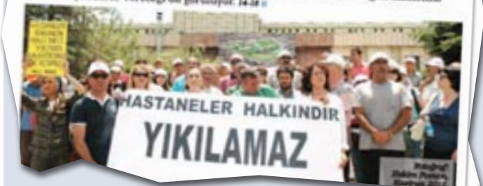
Hekim Postası, Şubat 2018

Kamu Hastaneleri Genel Müdürlüğü İstatistik, Analiz, Raporlama ve Stratejik Yönetim Dairesi Başkanlığı "Her Birine İlk 100 Hastane" 2017 yılı Ocak-Ekim dönemi poliklinik, yata, yoğun bakım ve acil servis istatistiklerini yayımladı. Türkiye genelinde Sağlık Bakanlığına bağlı hastanelerin sularda olduğu ilk 100 hastane listesinde Ankara'da Etilik ve Bilkent Şehir Hastanelerinin açılmasıyla kapatılması planlanan 13 hastane verilen hizmet yerlerinden ilk sıralarda yer alıyor. Müseyyen ayları, acil bakım yerleri, ameliyat sayıları bakımından Türkiye'de ilk sıralarda gelen kamu hastanelerinin kapatılacak olması Ankara'da yürütülen sağlık hizmetine katkıdan çok zarar vereceği ön görülüyor. 14.05