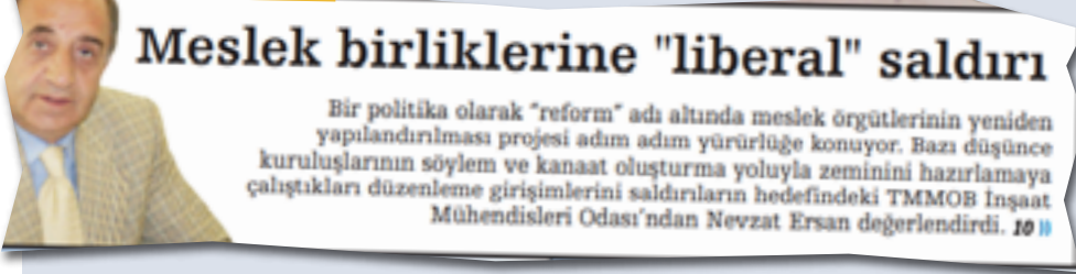
Hekim Postası, Ocak 2013