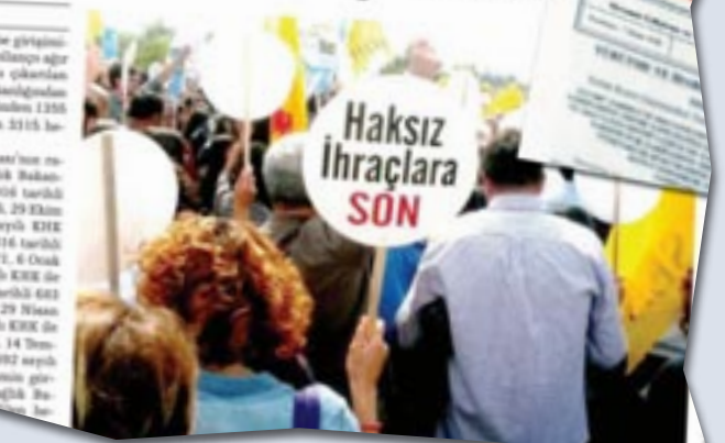
Hekim Postası, Ocak 2017