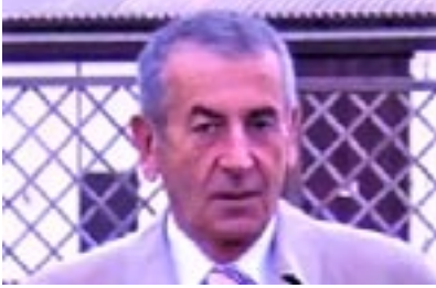
Dr. Göksel Kalaycı 11 Kasım 2005

Sağlıkta dönüşüm sürecinin başladığı 2002 yılından sonra hekim cinayetleri nedeniyle 7 hekim, mobbing baskısı ve ağır çalışma koşulları nedeniyle de 2 asistan hekim hayatını kaybetti. Şiddet istatistiklerinin tutulmaya başlandığı 2012 yılından 2022 yılına kadar geçen 10 yıllık süreçte 110 bini aşkın şiddet başvurusu yapıldı.