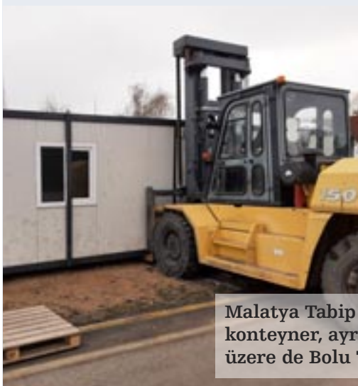
Malatya Tabip Odası'na, belirtilen ihtiyaç çerçevesinde konteyner, ayrıca bölgede koordinasyonda kullanılmak üzere de Bolu Tabip Odasıyla birlikte karavan ulaştırıldı.