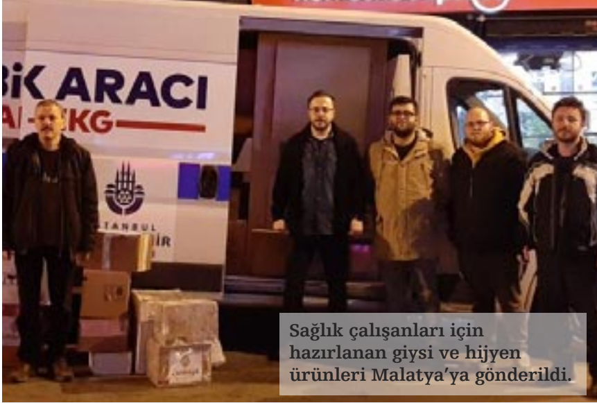
Sağlık çalışanları için hazırlanan giysi ve hijyen ürünleri Malatya'ya gönderildi.