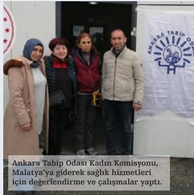
Ankara Tabip Odası Kadın Komisyonu, Malatya'ya giderek sağlık hizmetleri için değerlendirme ve çalışmalar yaptı.